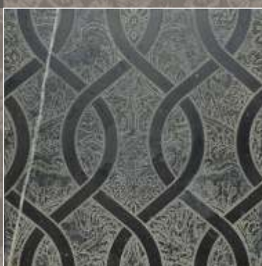
ASTER OLD Nero Marquinia