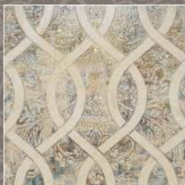
ASTER NS Royal Beige