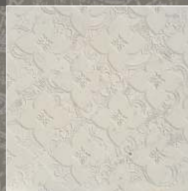
SIDUS LN Biancone