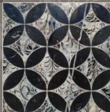
LUMEN NS Nero Marquinia