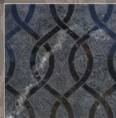
ASTER LN Nero Marquinia

OLD Acquaforse pigmentata, con anticatura eseguita a mano.