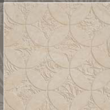
LUMEN LN Royal Beige