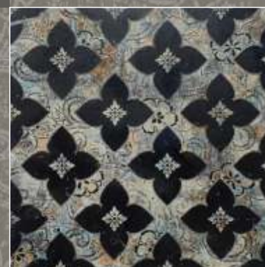
SIDUS N Nero Marquina

OLD Acquaforse pigmentata, con anticatura eseguita a mano. OLD G/S Acquaforse pigmentata, con anticatura eseguita a mano rifinita con polvere metallica gold/silver. LN Acquaforse senza pigmentazione, con finitura lucida. N Acquaforse decorata Multicolor N G/S Acquaforse decora Multicolor, rifinita con polvere metallica gold/silver.