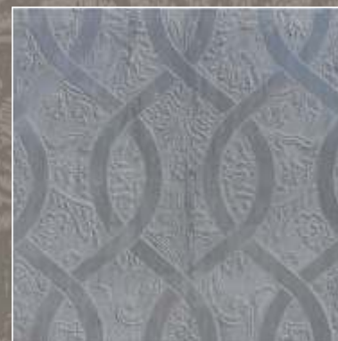
ASTER LN Bardiglio