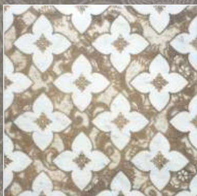
SIDUS OLD Bianco Carrara