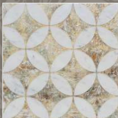
LUMEN NG Bianco Carrara