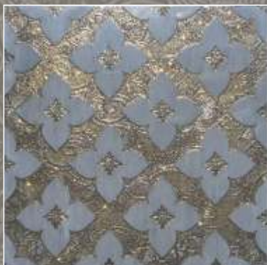
SIDUS OLD G Bardiglio