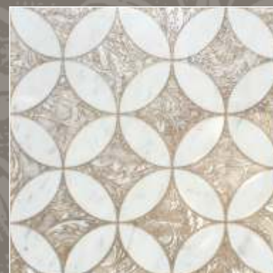
LUMEN OLD S Bianco Carrara