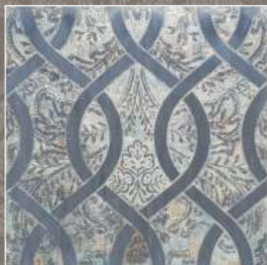
ASTER NS Bardiglio