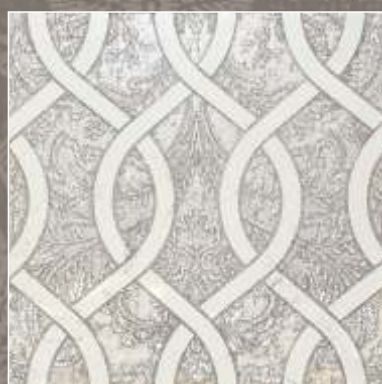
ASTER OLD S Biancone