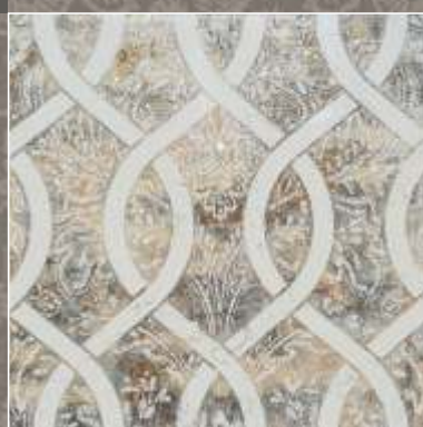
ASTER NG Biancone