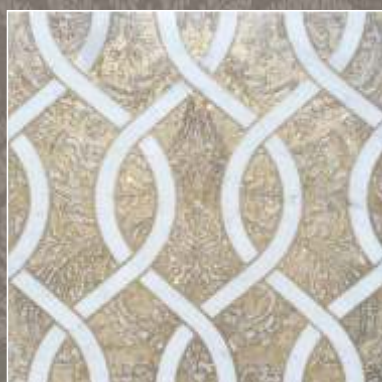
ASTER OLD G Bianco Carrara