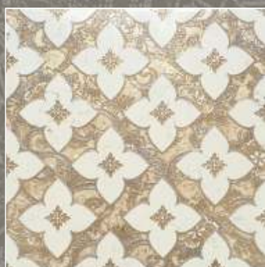
SIDUS OLD G Biancone