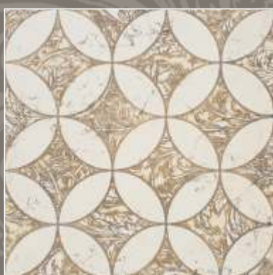
LUMEN OLD G Biancone