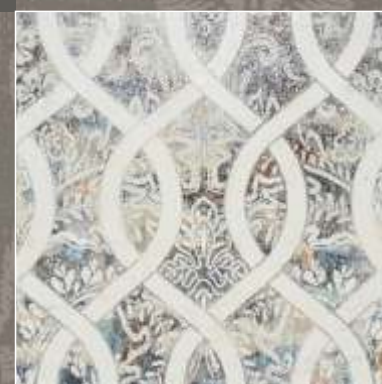
ASTER N Biancone