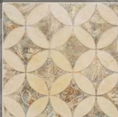
LUMEN NG Royal Beige