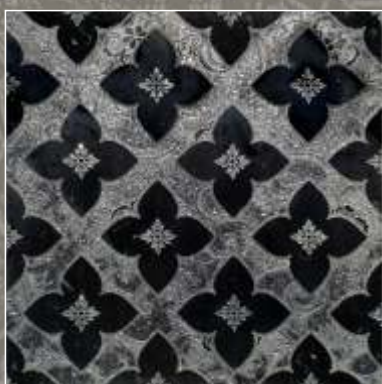
SIDUS OLD S Nero Marquina