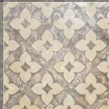
SIDUS OLD S Royal Beige