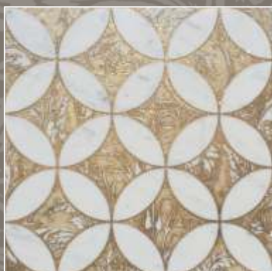
LUMEN OLD G Bianco Carrara