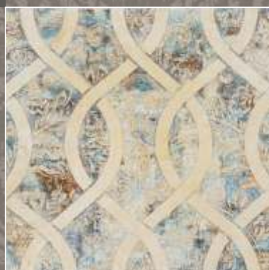
ASTER N Royal Beige