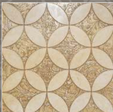
LUMEN OLD G Royal Beige