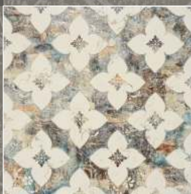
SIDUS N Biancone