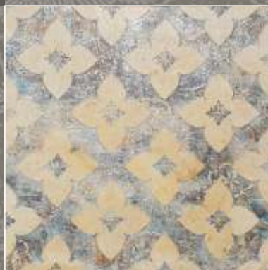
SIDUS NS Royal Beige