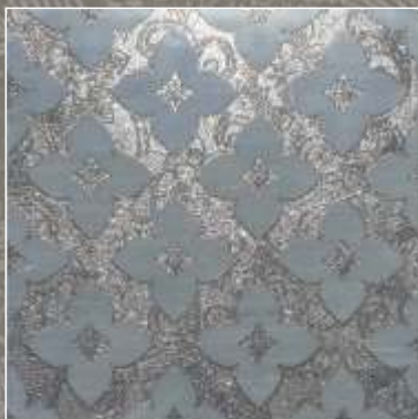
SIDUS OLD S Bardiglio