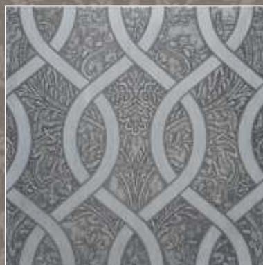
ASTER OLD Bardiglio