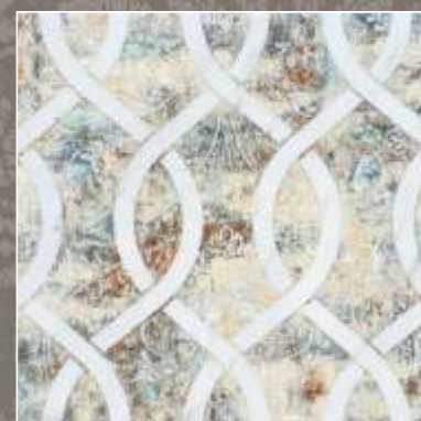
ASTER N Bianco Carrara