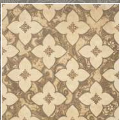
SIDUS OLD Royal Beige