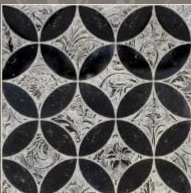
LUMEN OLD S Nero Marquinia