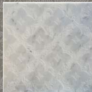
SIDUS LN Bianco Carrara