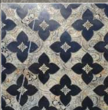
SIDUS NG Nero Marquina