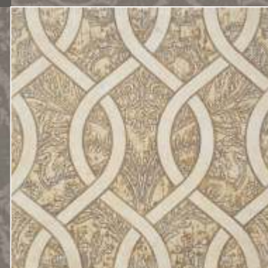
ASTER OLD Royal Beige