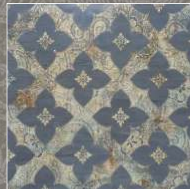
SIDUS NG Bardiglio