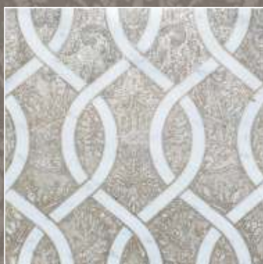
ASTER OLD S Bianco Carrara