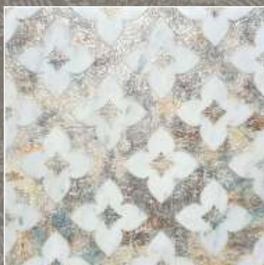
SIDUS NS Bianco Carrara