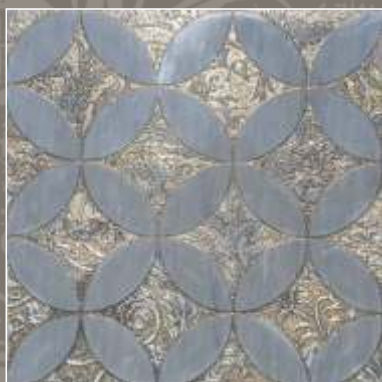
LUMEN OLD G Bardiglio