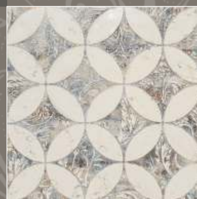
LUMEN NS Biancone