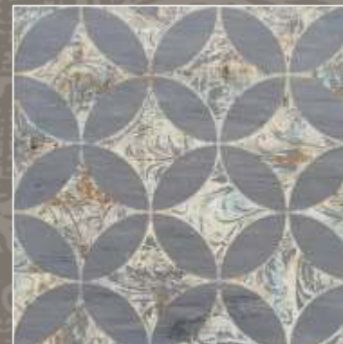
LUMEN N Bardiglio