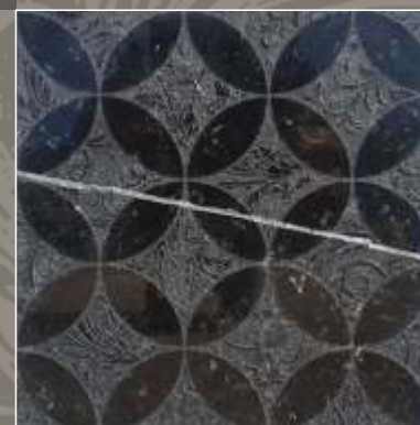
LUMEN LN Nero Marquinia

OLD Acquaforse pigmentata, con anticatura eseguita a mano.