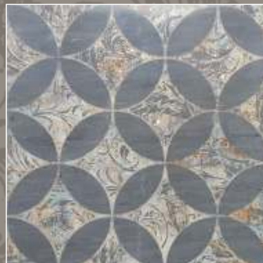
LUMEN NS Bardiglio