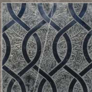
ASTER OLD S Nero Marquinia