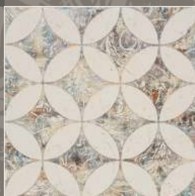
LUMEN N Biancone