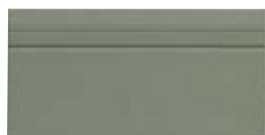
10x20 Zoccolo Bath OEZ4 - 105 PZ