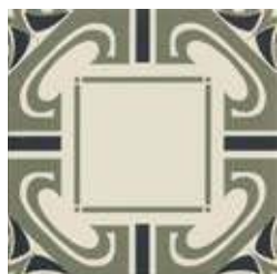
20x20 Dresda Salvia/Nero AHD45 - 133 MQ