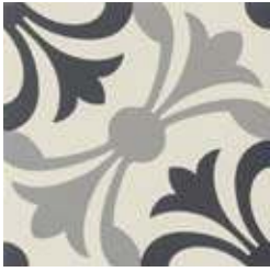
20x20 Lipsia Nero/Grigio AHL65 - 133 MQ