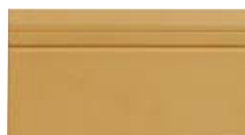
10x20 Zoccolo Leeds OEZ2 - 105 PZ