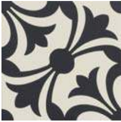
20x20 Lipsia Nero AHL5 - 134 MQ