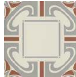
20x20 Dresda Grigio/Cotto AHD63 - 133 MQ