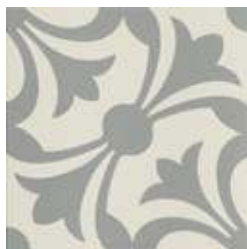
20x20 Lipsia Grigio AHL6 - 134 MQ