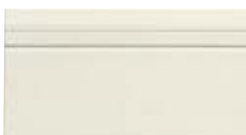
10x20 Zoccolo Dover OEZ1 - 105 PZ