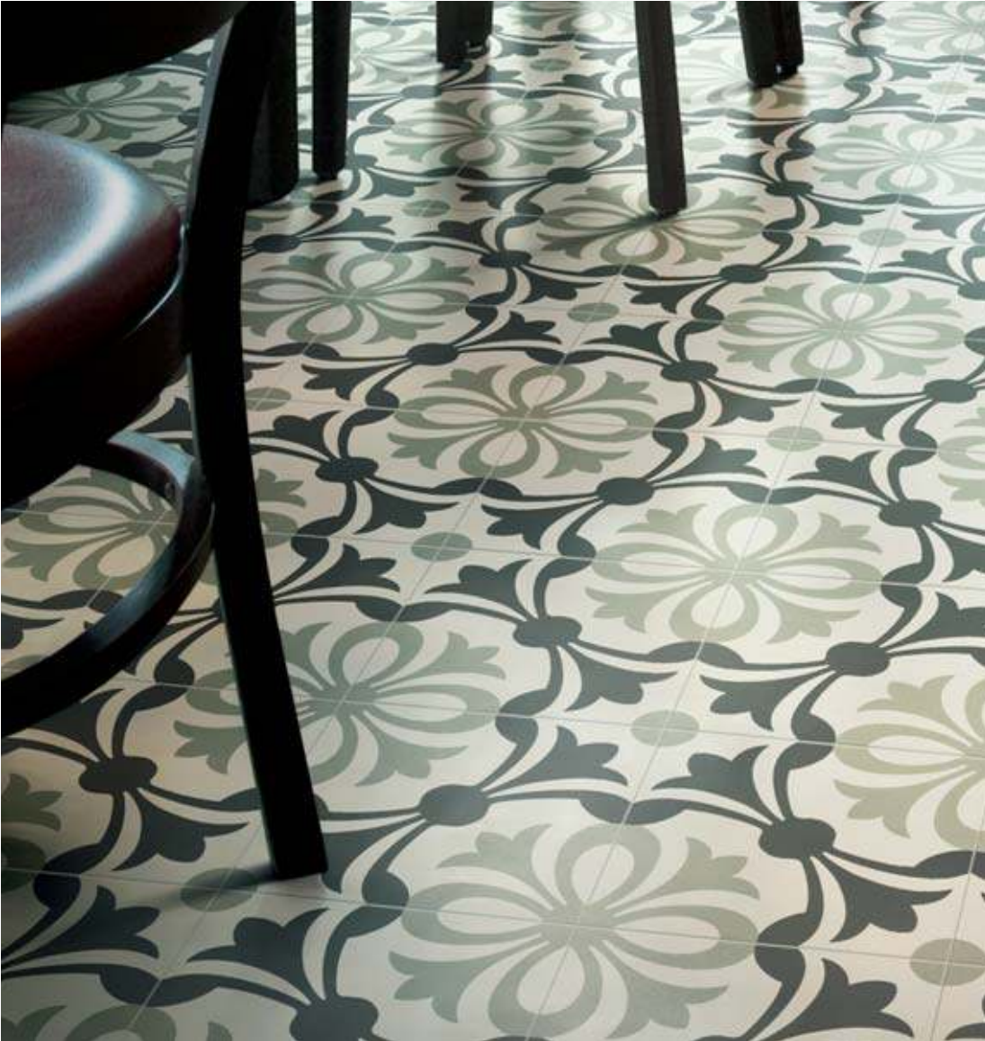
20x20 Lipsia Salvia/Nero