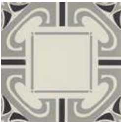
20x20 Dresda Grigio/Nero AHD65 - 133 MQ