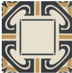
20x20 Dresda Nero/Ocra AHD52 - 133 MQ