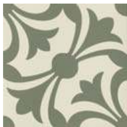
20x20 Lipsia Salvia AHL4 - 134 MQ