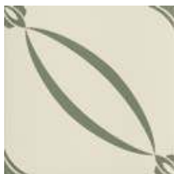
20x20 Berlino Salvia AHB4 - 134 MQ