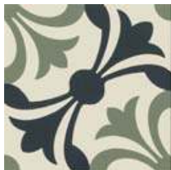
20x20 Lipsia Salvia/Nero AHL54 - 133 MQ