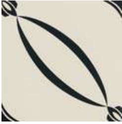
20x20 Berlino Nero AHB5 - 134 MQ