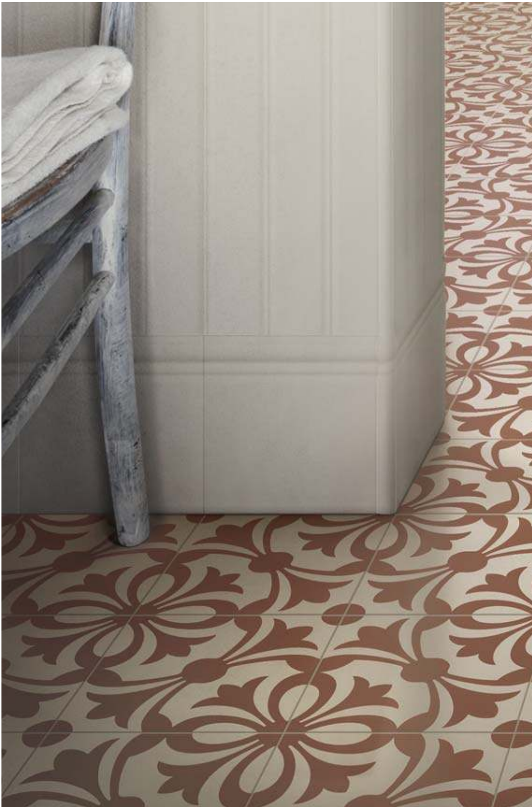
20x20 Lipsia Cotto 10x20 Zoccolo Chester Boiserie Finale - Zoccolo - Coprispoglo - Angoli Beige Matt