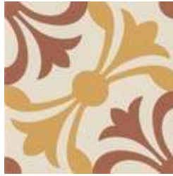
20x20 Lipsia Cotto/Ocra AHL23 - 133 MQ