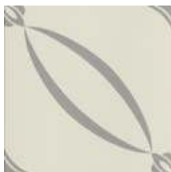
20x20 Berlino Grigio AHB6 - 134 MQ