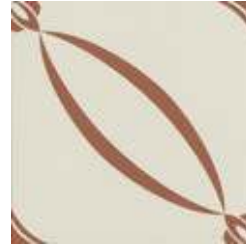
20x20 Berlino Cotto AHB3 - 134 MQ