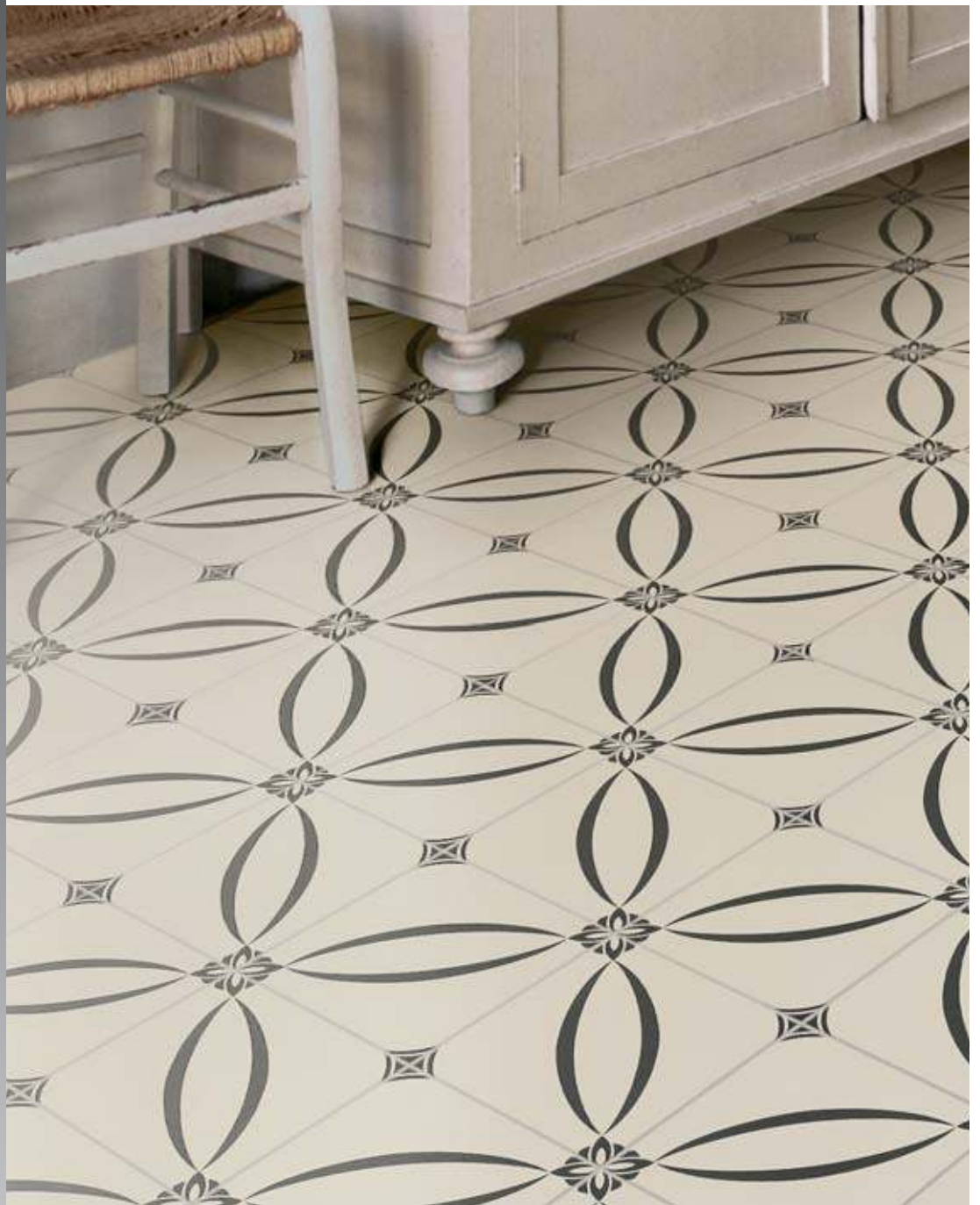
20x20 Berlino Nero 20x20 York