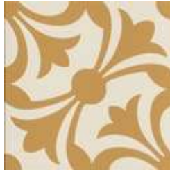
20x20 Lipsia Ocra AHL2 - 134 MQ