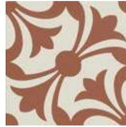
20x20 Lipsia Cotto AHL3 - 134 MQ