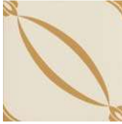
20x20 Berlino Ocra AHB2 - 134 MQ