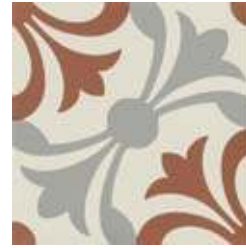
20x20 Lipsia Cotto/Grigio AHL63 - 133 MQ