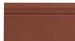
10x20 Zoccolo Chester OEZ3 - 105 PZ