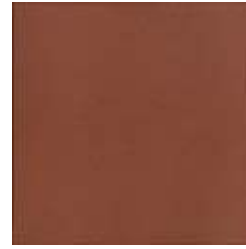
20x20 Chester OE3 - 92 MQ