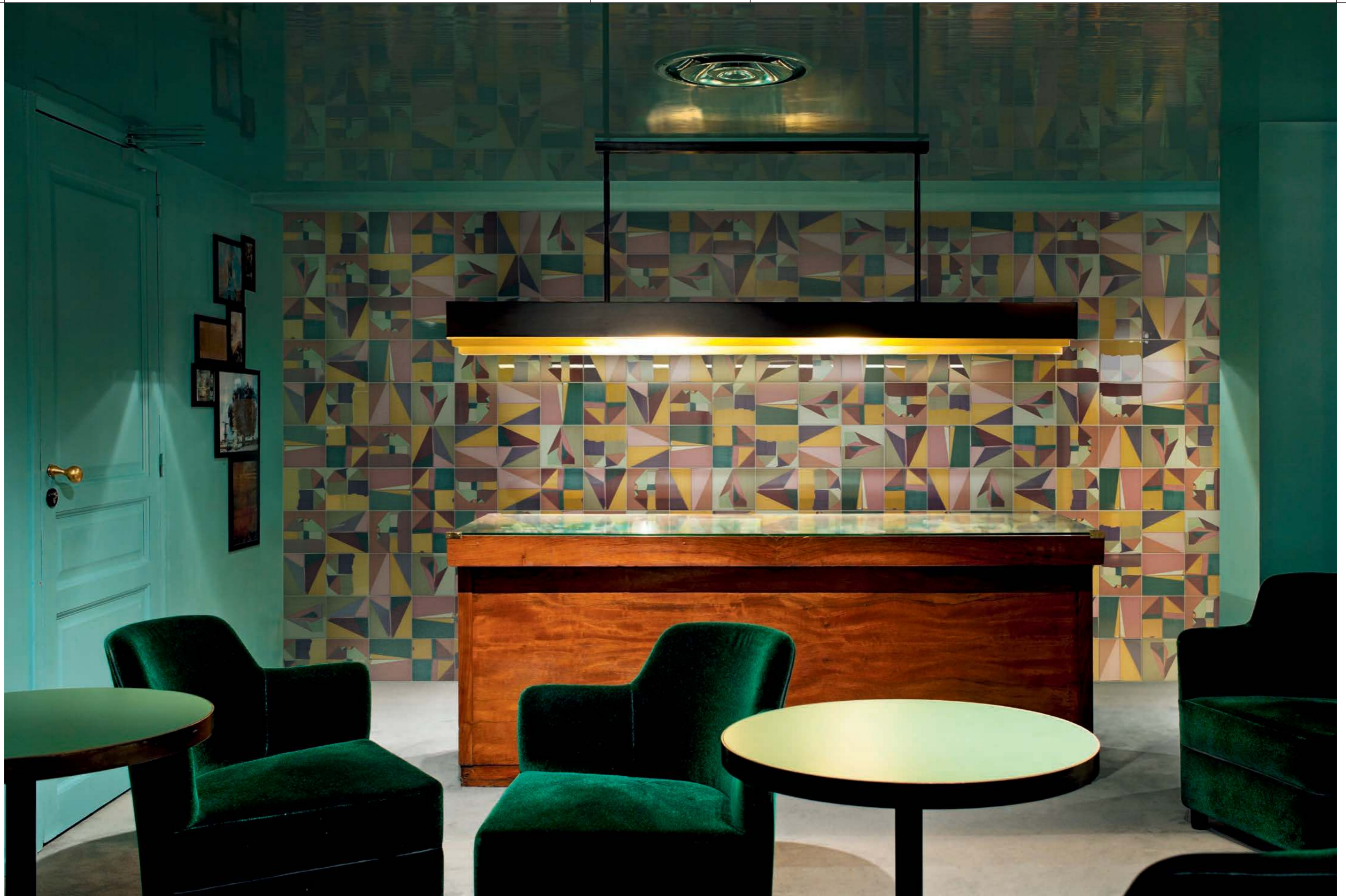
CONTRACT , Corrispondenza Rivestimento con posa a campo pieno / Covering all over layout