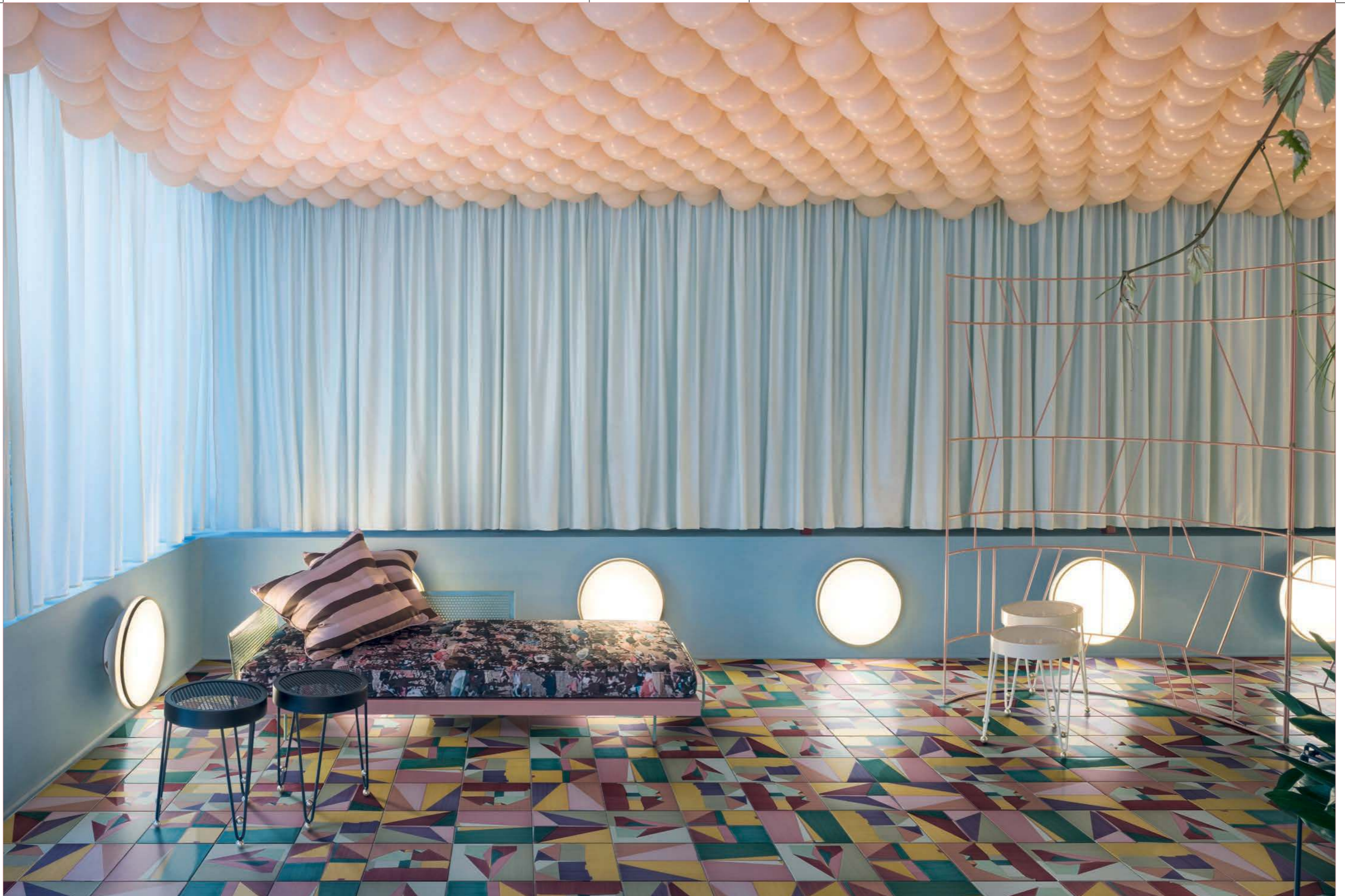
LIVING, Corrispondenza Pavimento posa a campo pieno / Flooring, all over layout