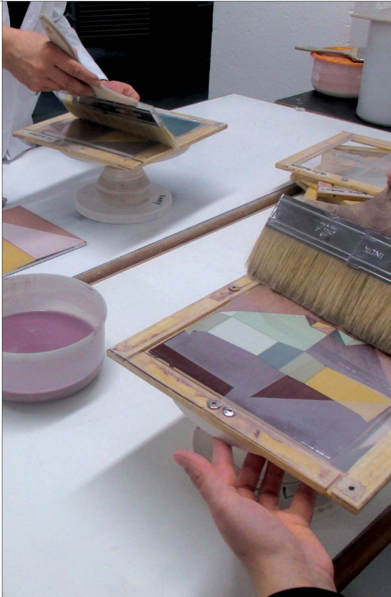
PENNELLATO A MANO / HAND PAINTED