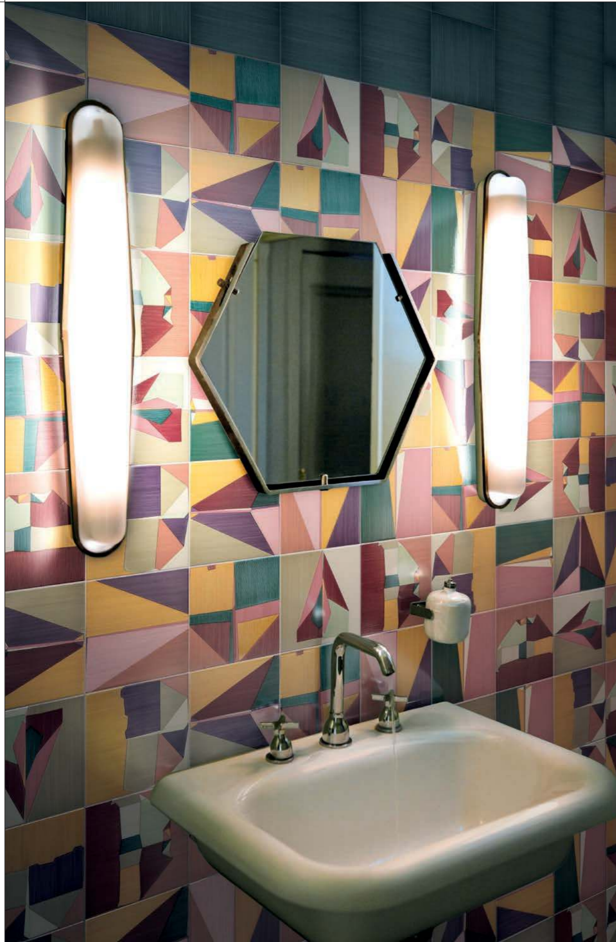
BAGNO/BATHROOM , Corrispondenza Rivestimento e pavimento in abbinamento con le tinte unite (CZ6) Covering and flooring, plain colours (CZ6) with decors