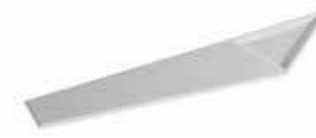
art. M75KR Mensola cm75 Shelf cm75