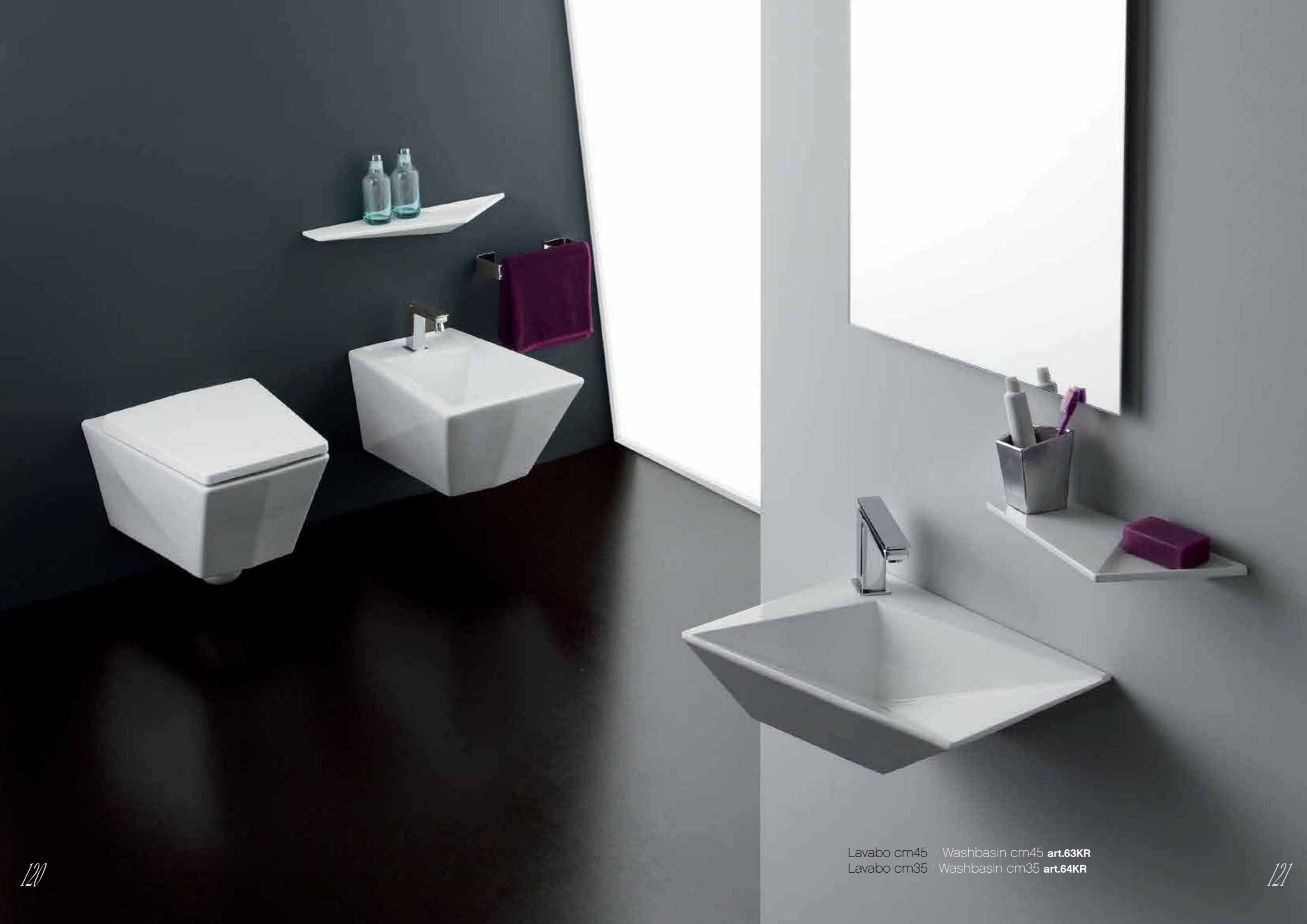
Lavabo cm45 / Washbasin cm45 art.63KR Lavabo cm35 / Washbasin cm35 art.64KR