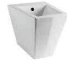
art. 05KR Bidet terra monoforo cm52 Back to wall one hole bidet cm52