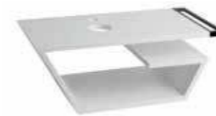
art. MOKR Mobile sosp. per art. 09KR / 28KR Wall hung furniture for art. 09KR / 28KR