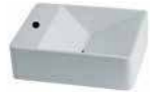
art. 29KR Lavabo cm50X40 Washbasin cm 50X40 art. 29KRB - white □ art. 29KRP - platinum ■ art. 29KRBP -white plat □■