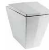
art. 03KR Vaso terra cm52 Wc back to wall cm52