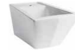
art. 17KR Bidet sospeso monoforo cm54 Wall hung one hole bidet cm54