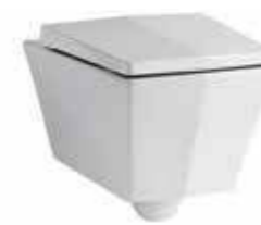
art. 15KR Vaso sospeso cm54 Wall hung wc cm54