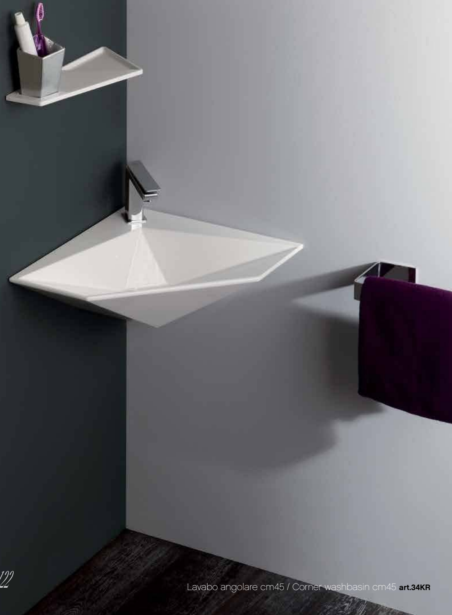
Lavabo angolare cm45 / Corner washbasin cm45 art.34KR