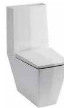
art. 04KR / 12KR Wc monoblocco btw cm62 Wc pan btw cm Cassetta monoblocco 42x13 cm Cistern for wc pan 42x13 cm