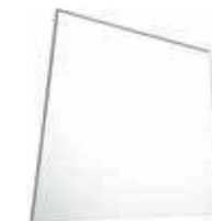
art. SPKR Specchio reversibile cm75/60 Reversible mirror cm75/60