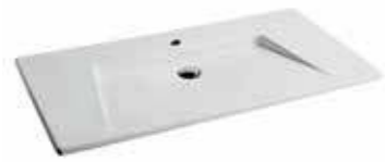
art. 81KR Lavabo cm100X52 Washbasin cm100X52