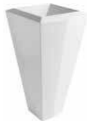
art. 31KR Lavabo centro stanza cm45 Free standing washbasin cm45