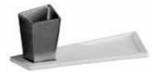
art. M45KR Mensola con bicchiere cm35 Shelf with glass cm35