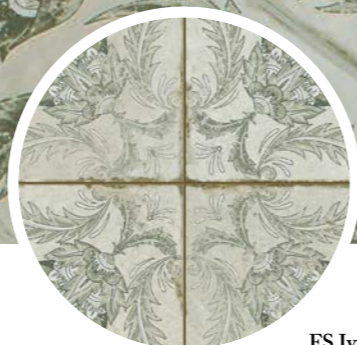
FS Ivy Sage