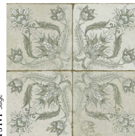
FS IVY Sage