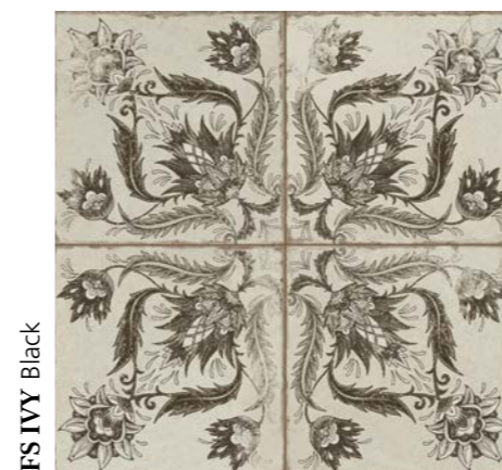
FS IVY Black