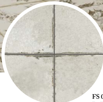
FS 0 D. FS Fringe White