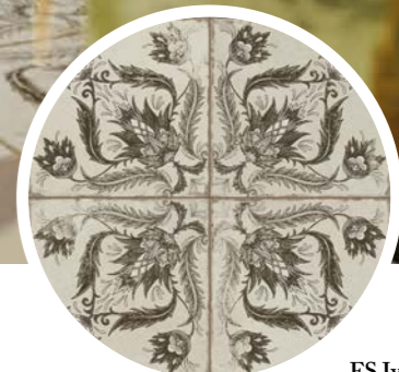
FS Ivy Black