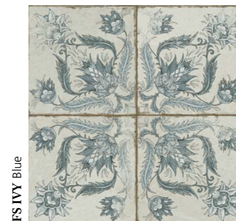
FS IVY Blue