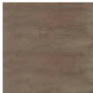
HEM 8 60x60 cm 24x24 in 061