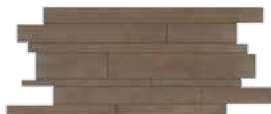
Muretto / HEM 8 30x60 cm 12x24 in 041 • 2 soggetti in sequenza • 2 different designs in sequence • 2 Motive in Reihenfolge • 2 sujets en séquence