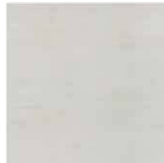
HEM 5 60x60 cm 24x24 in 061