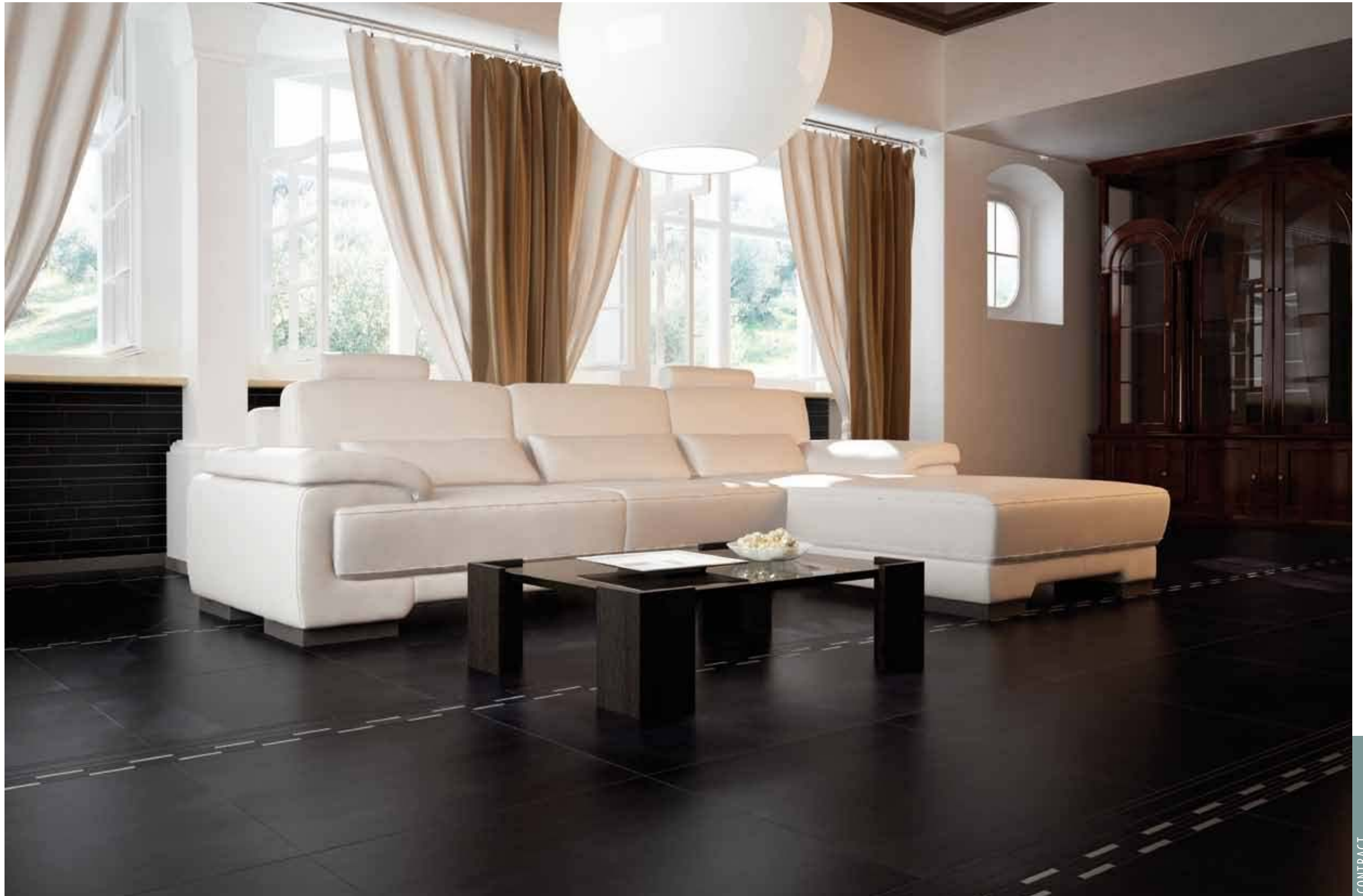
HEM 18 - Fascia Elementi / HEM 18 - Muretto / HEM 18