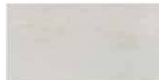
HEM 5 30x60 cm 12x24 in 056