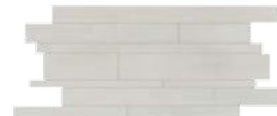
Muretto / HEM 5 30x60 cm 12x24 in 041 • 2 soggetti in sequenza • 2 different designs in sequence • 2 Motive in Reihenfolge • 2 sujets en séquence