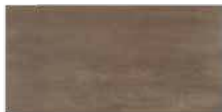
HEM 8 30x60 cm 12x24 in 056