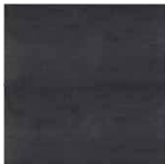
HEM 18 60x60 cm 24x24 in 061