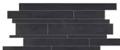
Muretto / HEM 18 30x60 cm 12x24 in 041 • 2 soggetti in sequenza • 2 different designs in sequence • 2 Motive in Reihenfolge • 2 sujets en séquence