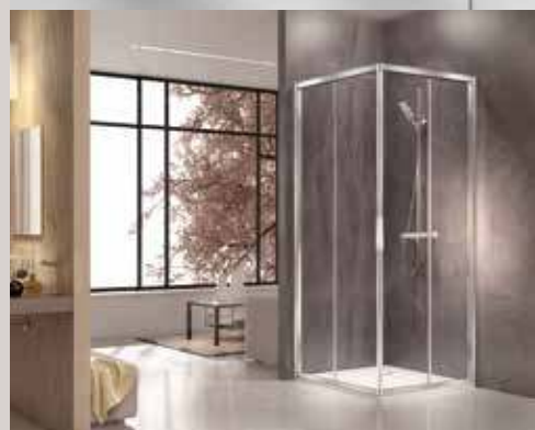
A10 прозрачное стекло A10 transparent