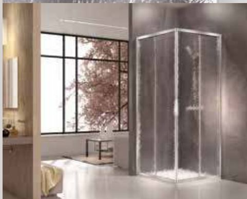
C10 узорчатое стекло Cincilla C10 Cincilla