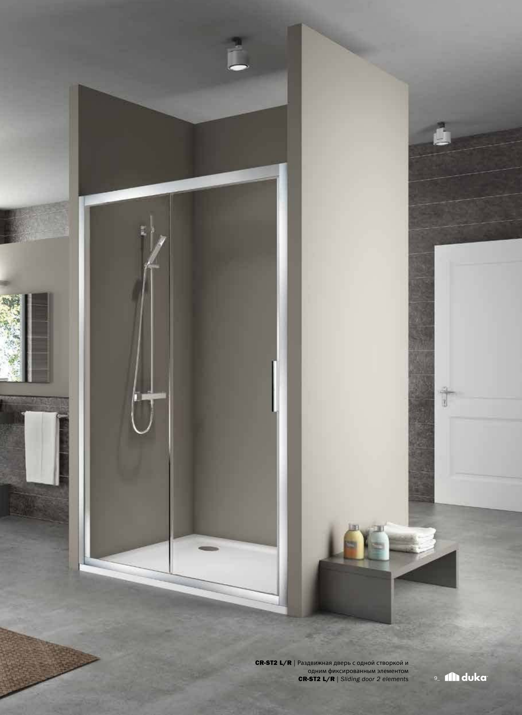
CR-ST2 L/R | Раздвижная дверь с одной створкой и одним фиксированным элементом CR-ST2 L/R | Sliding door 2 elements