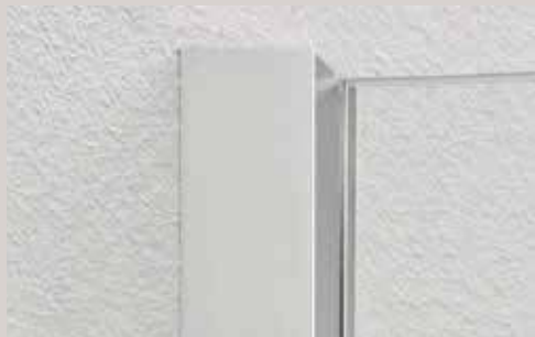
SIL матовое серебро SIL silver mat