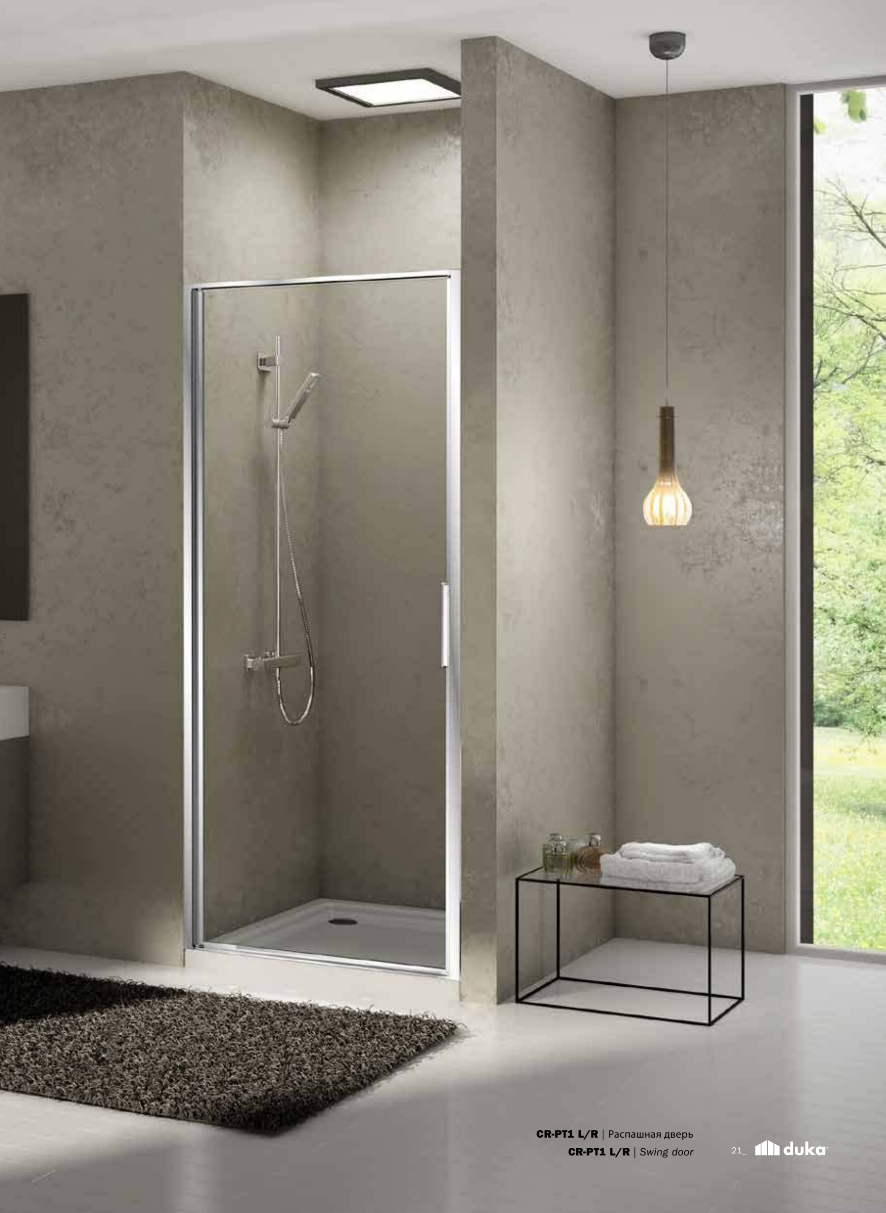
CR-PT1 L/R | Распашная дверь CR-PT1 L/R | Swing door