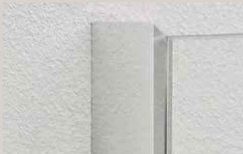
SHL блестящее серебро SHL silver high polish