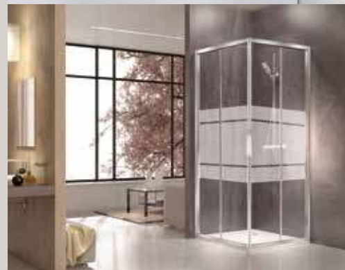
TS10 прозр. стекло с сатинир. трафаретной печатью по центру стекла TS10 white silk- screen print, centre of the glass