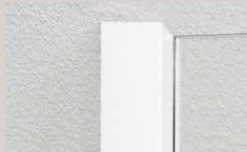
WEI белый WEI white