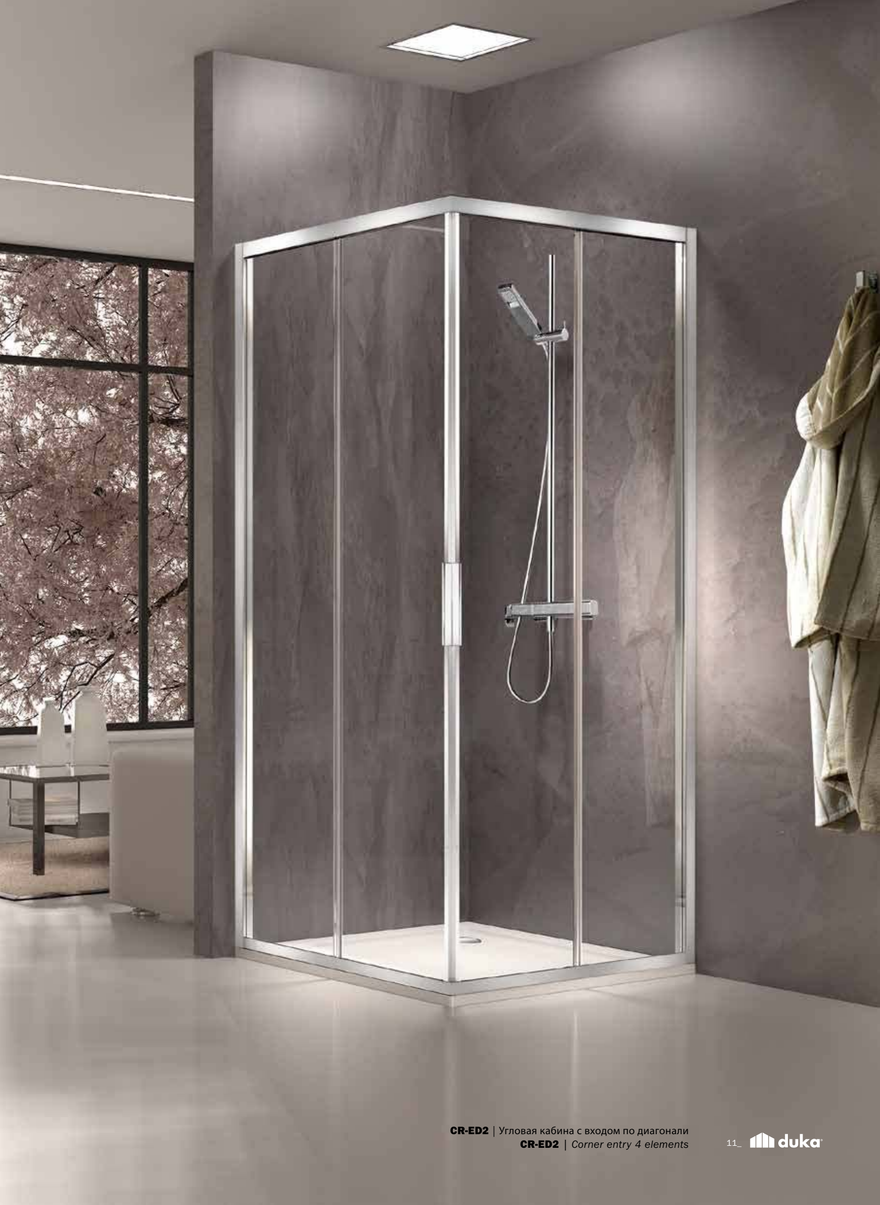
CR-ED2 | Угловая кабина с входом по диагонали CR-ED2 | Corner entry 4 elements