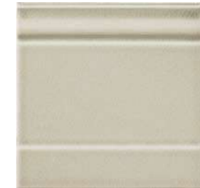
20x20x2 Zoccolo Argent Cr. ZOM3 - 105 PZ