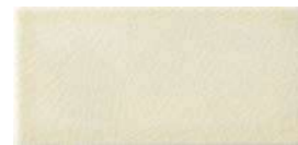
10x20x1 Ivoire Cr. MAI200 - 91 MQ