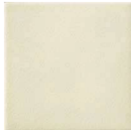
20x20x1 Ivoire Cr. MAI2 - 94 MQ