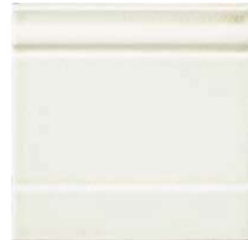
20x20x2 Zoccolo Blanc Cr. ZOM1 - 105 PZ