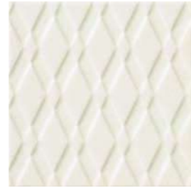
20x20x1 Pigalle Blanc Cr. PIG1 - 132 MQ