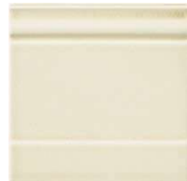
20x20x2 Zoccolo Ivoire Cr. ZOM2 - 105 PZ