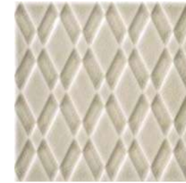
20x20x1 Pigalle Argent Cr. PIG3 - 132 MQ