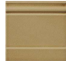
20x20x2 Zoccolo Noix Cr. ZOM4 - 105 PZ