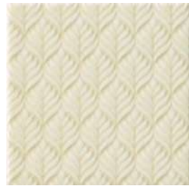
20x20x1 Marais Ivoire Cr. MAR2 - 132 MQ