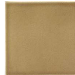
20x20x1 Noix Cr. MAI4 - 94 MQ