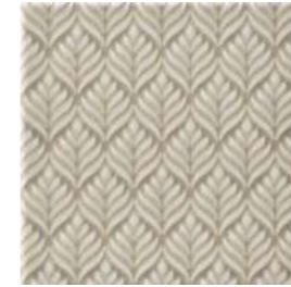
20x20x1 Marais Argent Cr. MAR3 - 132 MQ