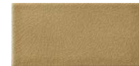
10x20x1 Noix Cr. MAI400 - 91 MQ