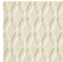
20x20x1 Pigalle Ivoire Cr. PIG2 - 132 MQ