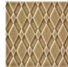
20x20x1 Pigalle Noix Cr. PIG4 - 132 MQ