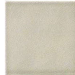
20x20x1 Argent Cr. MAI3 - 94 MQ