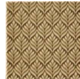
20x20x1 Marais Noix Cr. MAR4 - 132 MQ