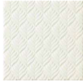
20x20x1 Marais Blanc Cr. MAR1 - 132 MQ